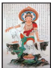
The Great Compassionate Bodhisattva(Kuan-Yin; Avalokitesvara) on the Combination of Mahayana and Vajrayana system "The Mahayana Sutra on the King of the Auspicious Treasure"(Part 1 ~ 3) (The combination of Buddhist History, Doctrine and Art)

顯密圓通的大悲觀世音菩薩 《大乘莊嚴寶王經》 (佛教歷史、教義與藝術的結合) (第一至第三部分) 華語主講：心宏法師