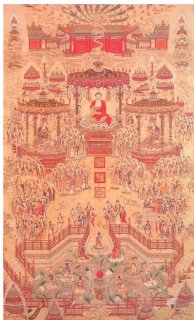
清朝彩繡西方極樂世界圖，藏於故宮博物院