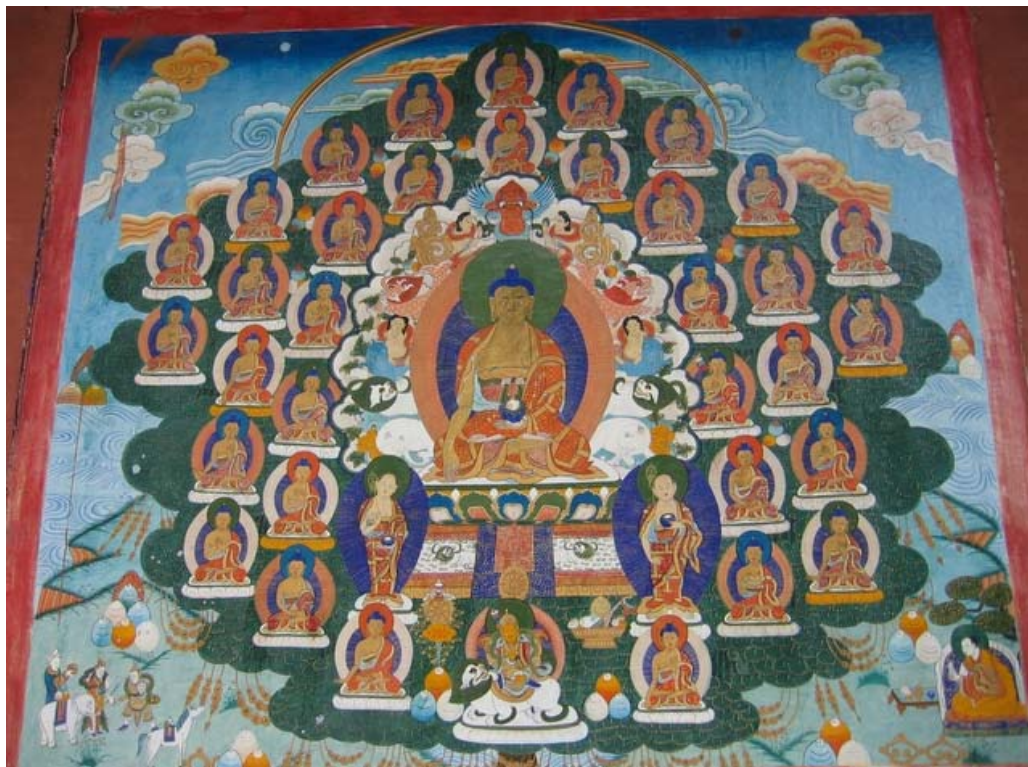
中國五台山鎮海寺三十五佛壁畫