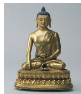
釋迦摩尼佛降魔像

5.【Discovery DVD】：《快樂的力量》(Science Frontiers: Pleasure Power)