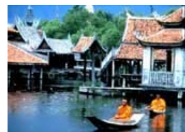
聲聞菩提倚草筏 獨一無二