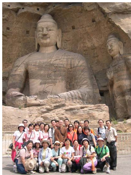
2004 年 7 月師生合照於雲岡石窟