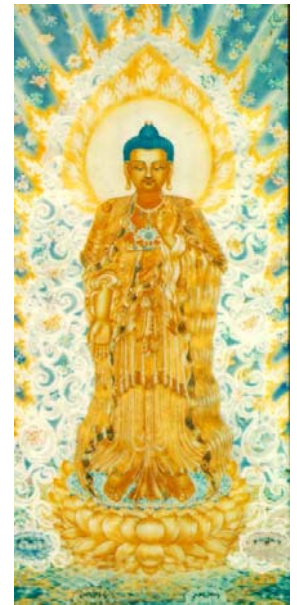
阿彌陀佛 道證法師繪

南非苦難的難民，瘦得被禿鷹吃。主角用高蛋白牛奶一滴滴的將難民救活。非佛教徒的慈善事業，一念功德心都比我們佛教徒還大。