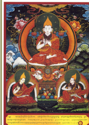
宗喀巴大師與賈曹傑（右）與克主傑（左）