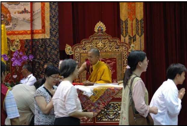
再依次為在家居士，上前接受灌頂。