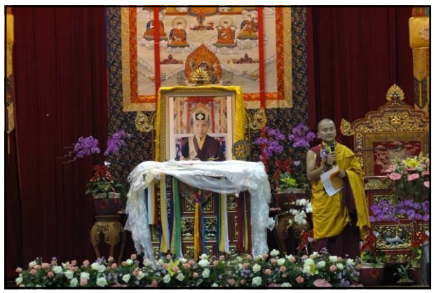
貢噶仁波切恭讀 法王由印度傳來的信函。