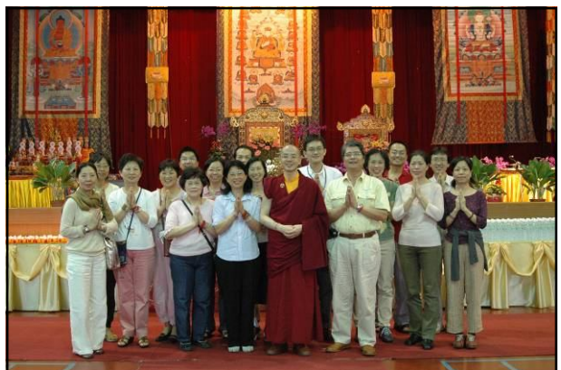
法會圓滿 法喜充滿 桑耶精舍(SBA)幹部合照