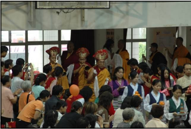
下午13:00開始正式迎請 法王法相陞座。