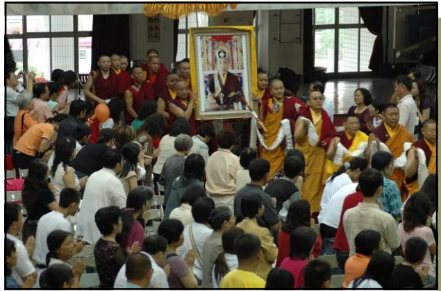
恭迎 法王法像進入會場。