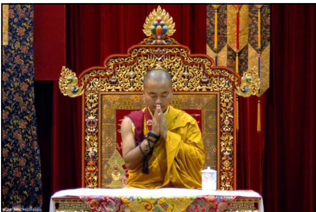
法會結束前，仁波切慈悲帶領大眾，做最後迴向發願。