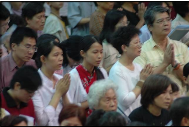
當大家看到法照時，彷彿 尊貴的 大寶法王親臨會場 每個人都以最恭敬、虔誠的心，迎請法王。