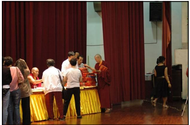
灌頂完，桑耶精舍(SBA)準備精緻的「尊貴的 大寶法王與貢噶仁波切」的簽名合照，與大眾結緣。