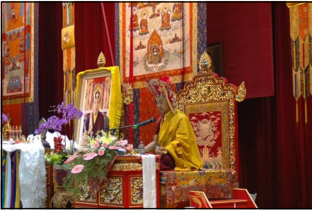
慶生完後，仁波切給予白度母的長壽灌頂。