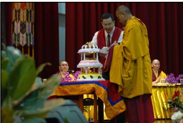
唱誦完祈請文後，由仁波切 切蛋糕。