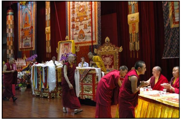
先由法師們，上前接受灌頂。