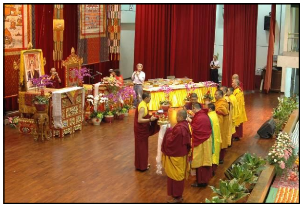
貢噶仁波切和其他七位仁波切及喇嘛們， 向尊貴的 大寶法王獻上身、口、意的供養。