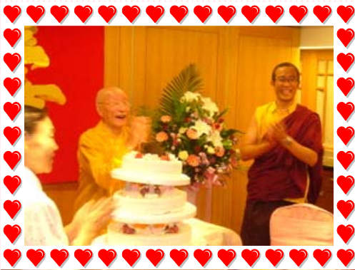
親愛的仁波切，80歲生日快樂！