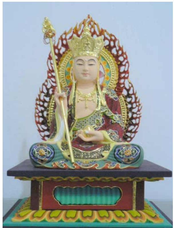
圖：普賢菩薩 (上)；地藏菩薩 (下)