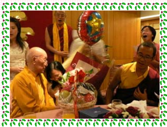
獻果、獻花、大聲唱 祈願上師壽無疆