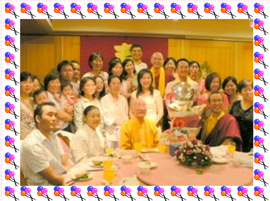
生生世世永相隨 菩提眷屬大圓滿