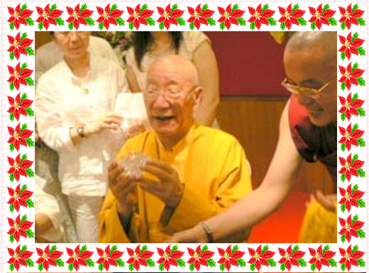
師父代表我們獻上水晶蓮