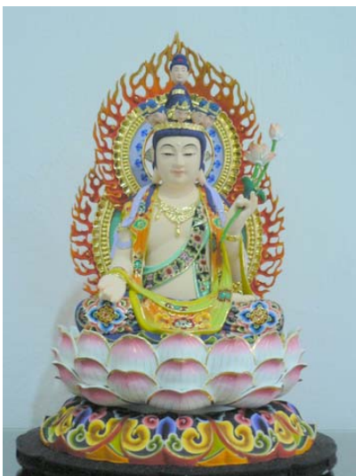
圖：文殊菩薩(上)，蓮花手觀音—唐代大丈夫造像(左上)；觀音菩薩(左下)