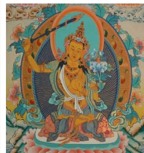
文殊師利菩薩

願是一個堅定的目標，也是一種積極的動力。每當自己修行的障礙出現時，或痛苦出現時，願力是推動自己發起「出離心、厭離心」的根源。「眾生界盡」是惑、「眾生業盡」是業、「眾生煩惱盡」是苦。凡夫沒定力、與修正觀的功德力，所以發心後，是很容易變動、與退轉的；反之，佛菩薩所發的願力，有堅強的定力，念念為眾生著想；所以，從造像藝術的角度而言，佛菩薩背後的光環，是一直光亮的。