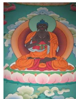
35佛中的4尊佛，SBA攝於尼泊爾倫比尼薩迦寺院