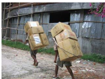
真實不難，勇猛難—路很難走啊！