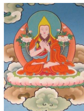
文殊師利菩薩之化身—宗喀巴大師 SBA攝於尼泊爾倫比尼薩迦寺廟