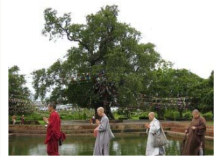
4.右繞三匝菩提樹前水池

啊！於是佛陀，讓我們在菩提樹前、在菩提樹下禮讚您！供養您！讓我們以身語意全然奉獻於您、奉獻於法，願常隨您學、隨順眾生、普皆迴向！