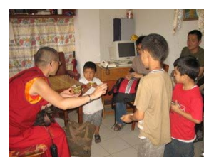
不退心不難，無盡難—