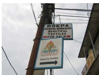
勇猛不難，長遠難—ROKPA育幼院&婦女工作坊 還在前方

在此，要附帶說明的是：真誠地讀經，或專心地持大悲神咒時，是不會著魔的。《般若波羅蜜經》云：「菩薩成就二法，魔不能障礙：觀一切法空，及不捨一切眾生。復次，二法、魔不能侵。隨說能行(註：解行相應，表裡如一)，諸佛護念(註：祈求佛菩薩加持，隨時念佛念咒)。」